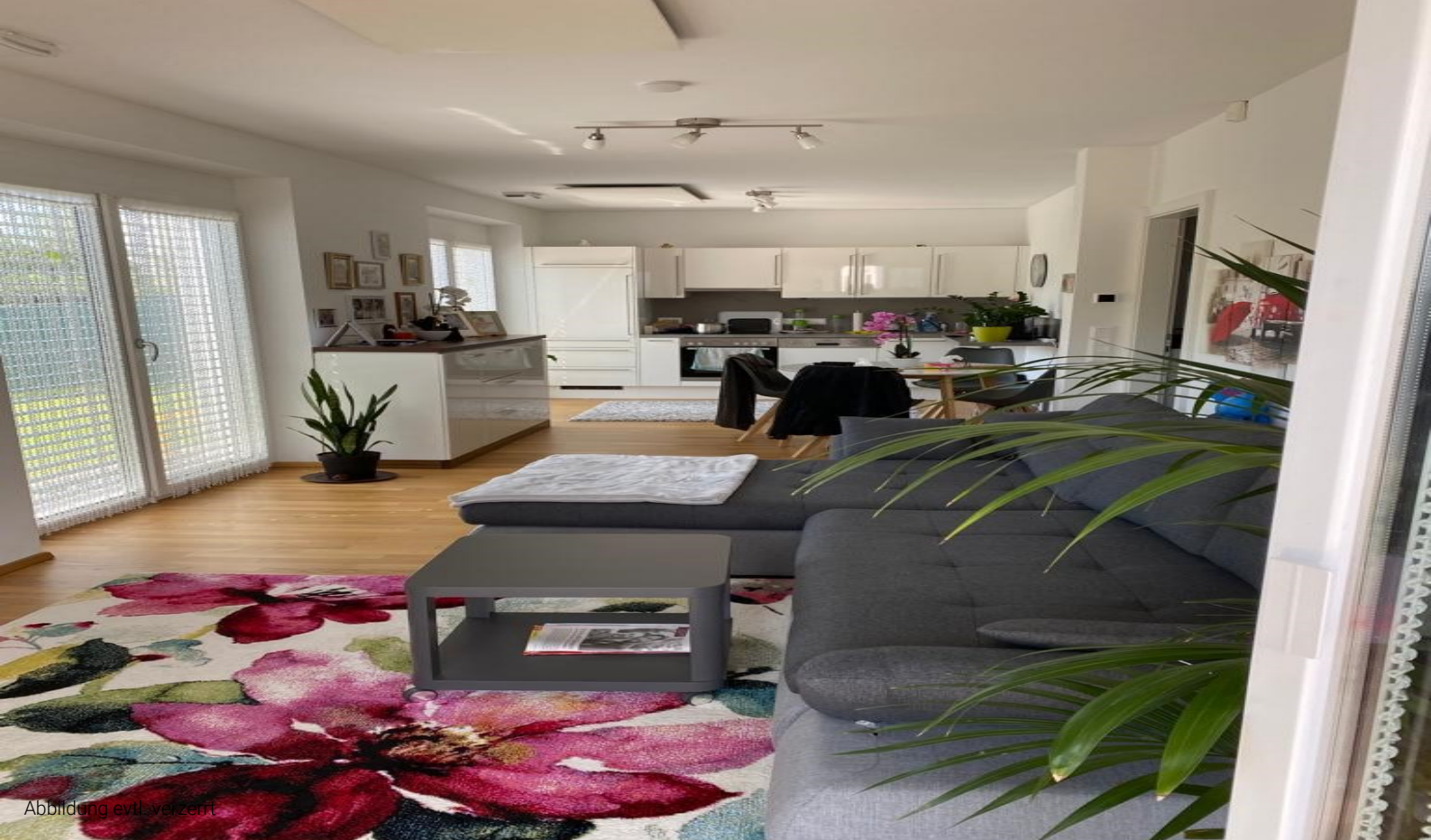
Abbildung evtl. verzerrt