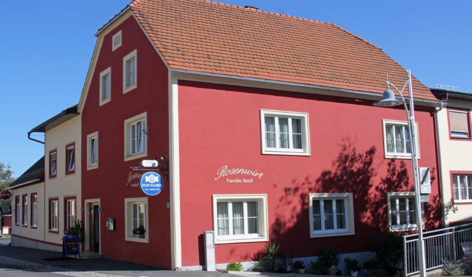
Abbildung evtl. verzerrt