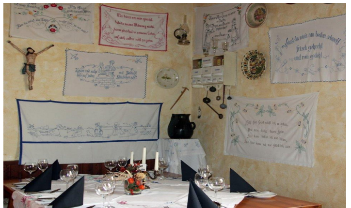
Abbildungen evtl. verzerrt