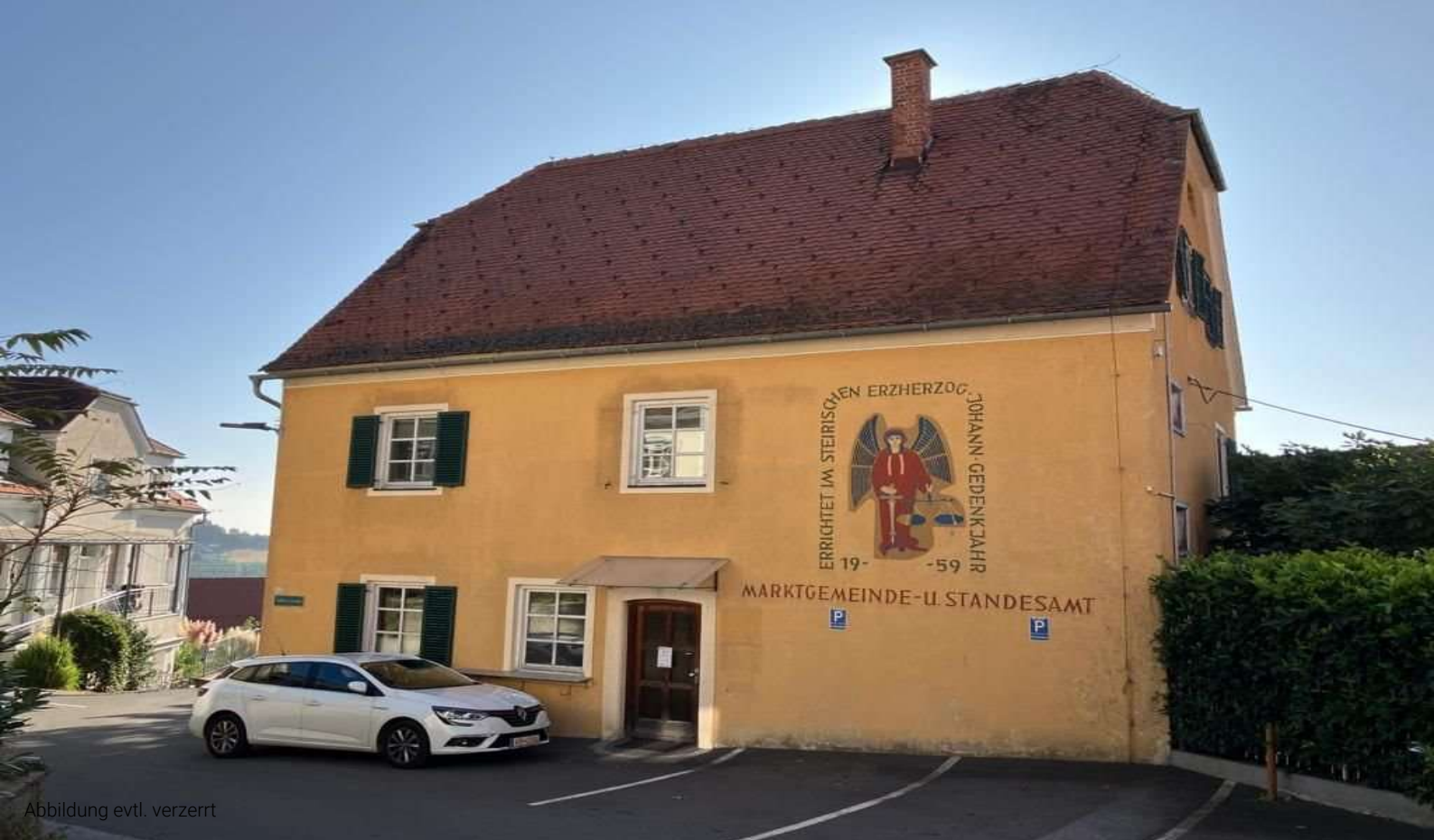
Abbildung evtl. verzerrt