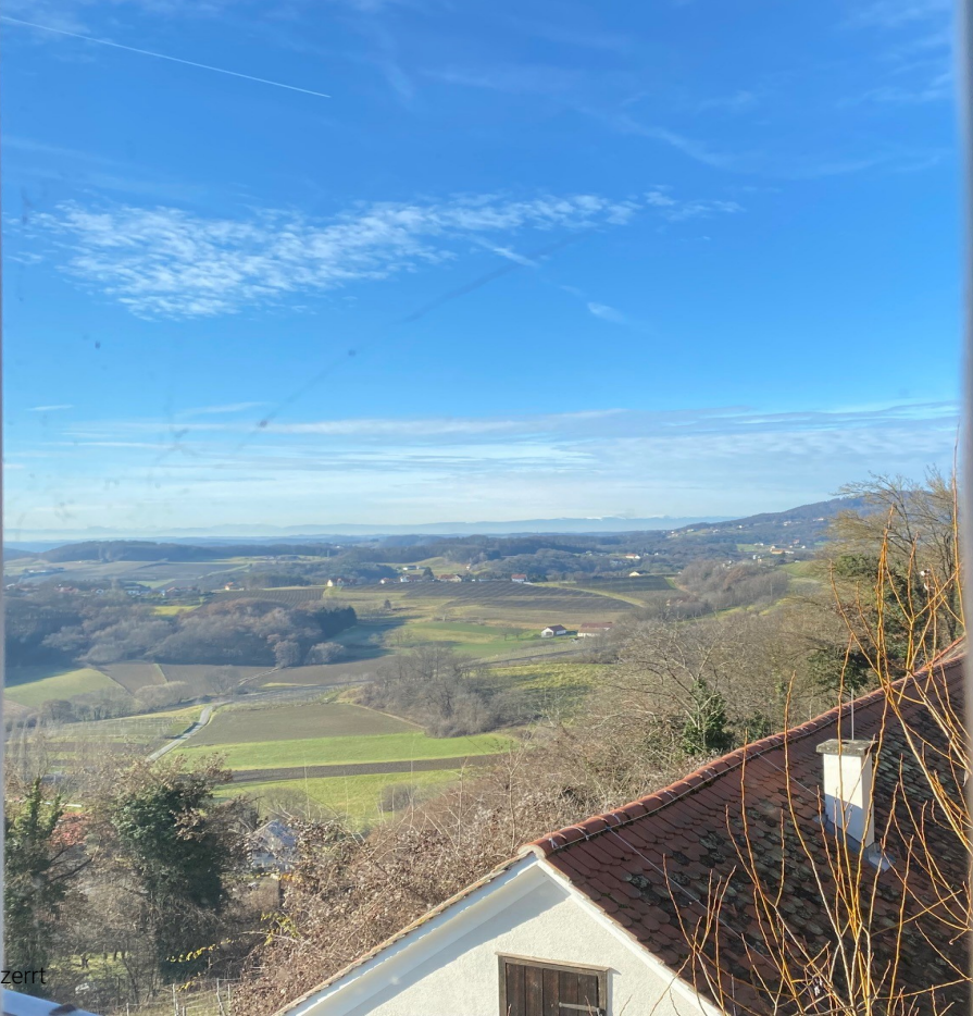
Abbildung evtl. verzerrt