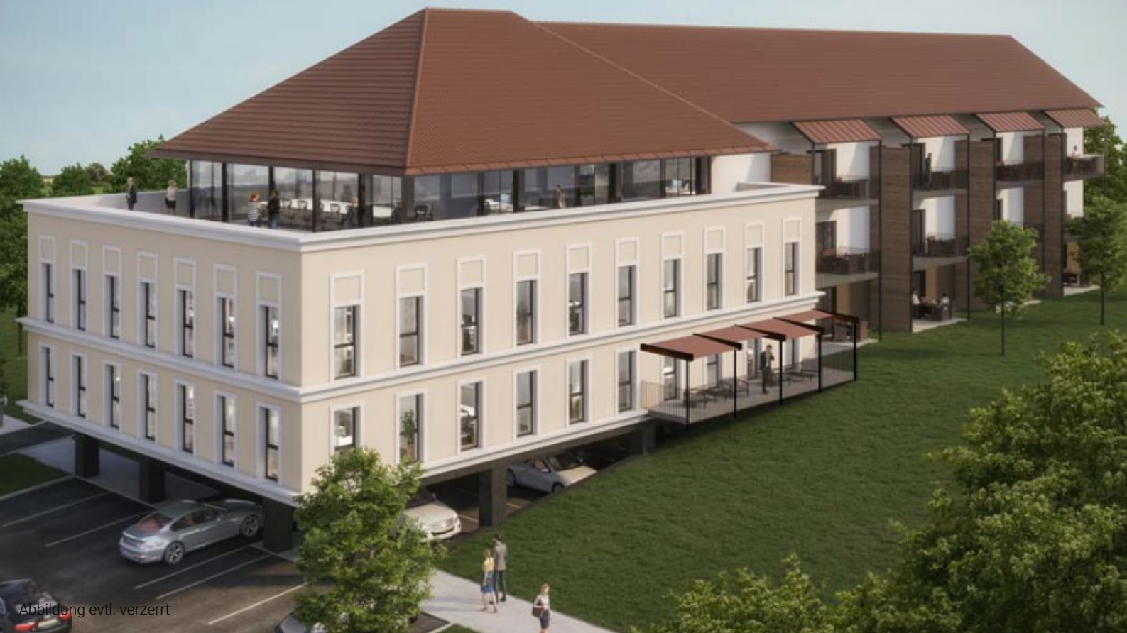
Abbildung evtl. verzerrt