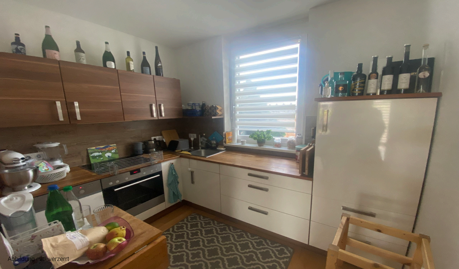
Abbildung evtl. verzerrt