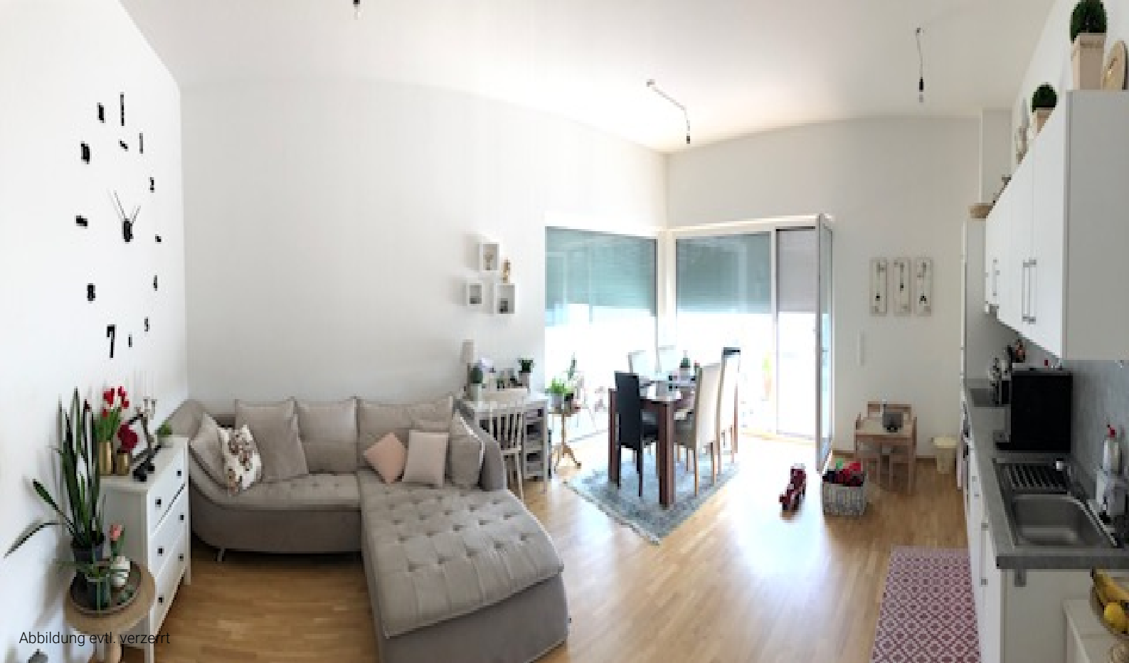
Abbildung evtl. verzerrt