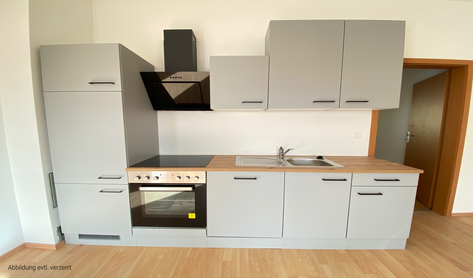
Abbildung evtl. verzerrt