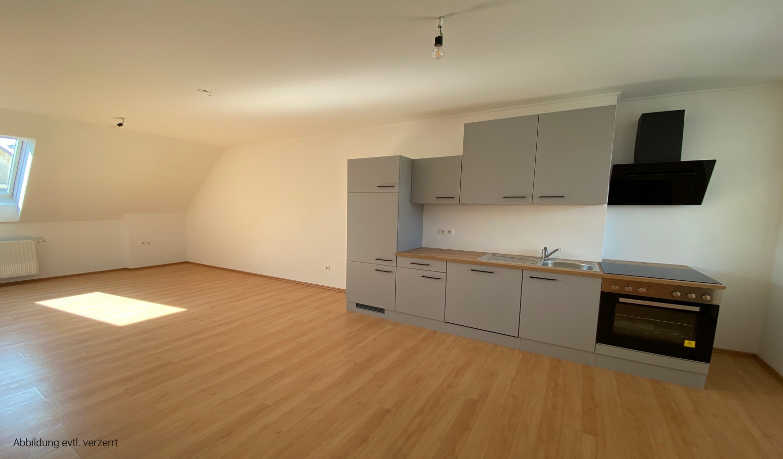
Abbildung evtl. verzerrt