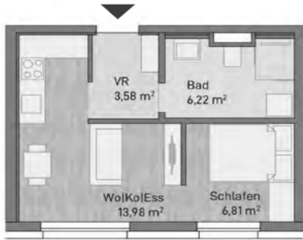
Abbildung evtl. verzerrt