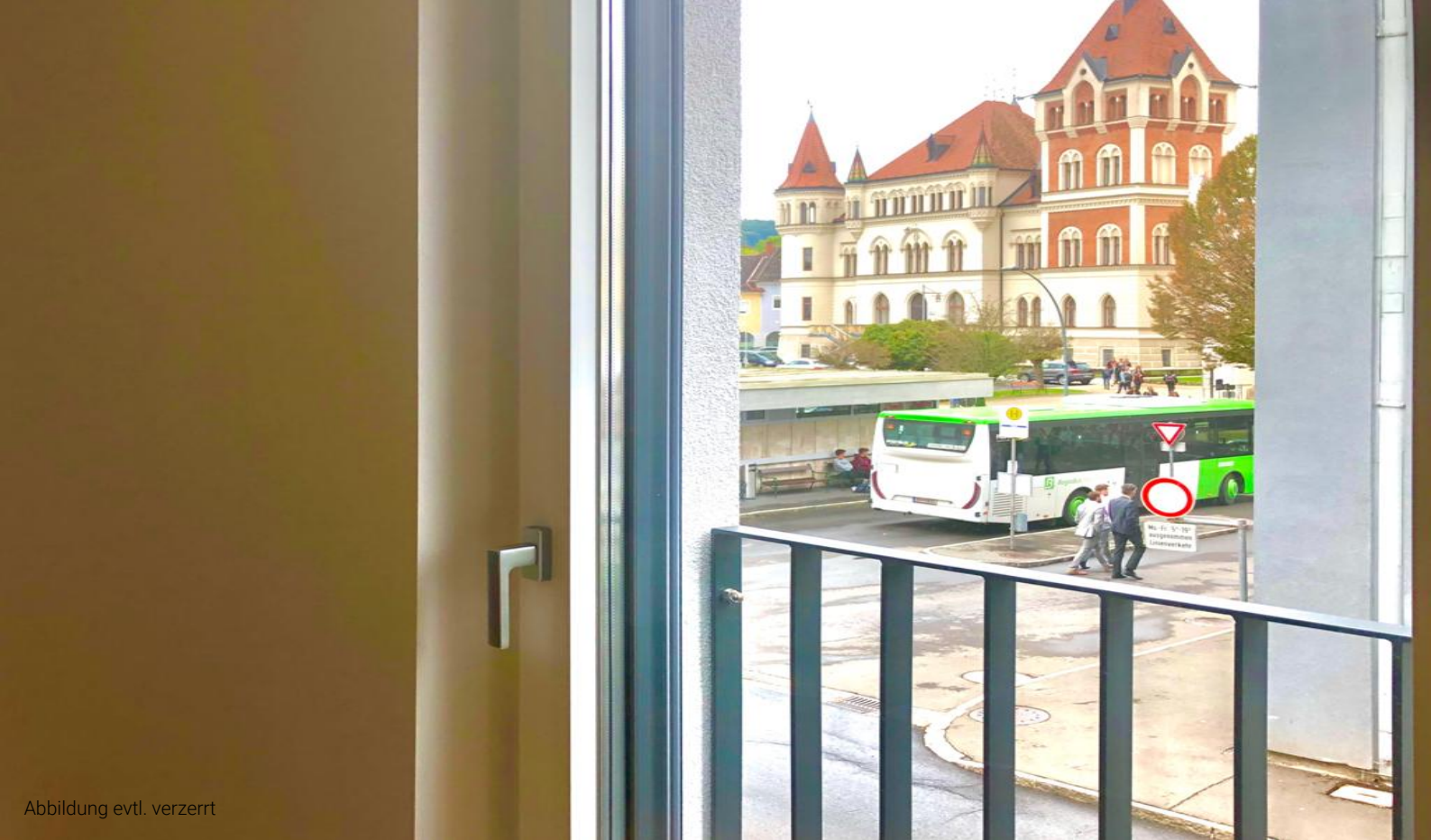
Abbildung evtl. verzerrt