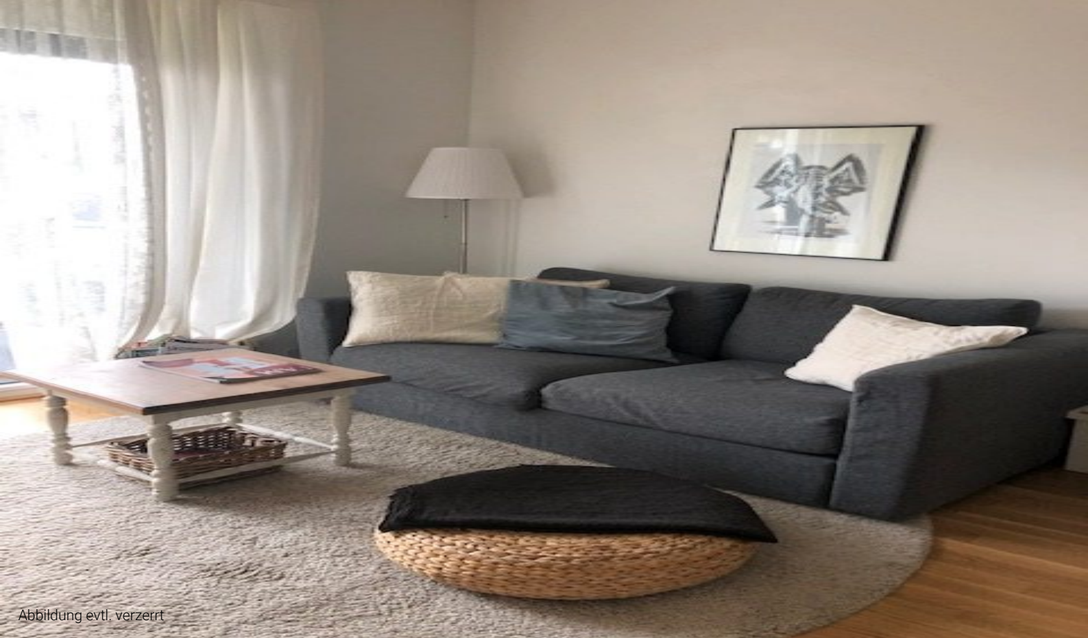
Abbildung evtl. verzerrt