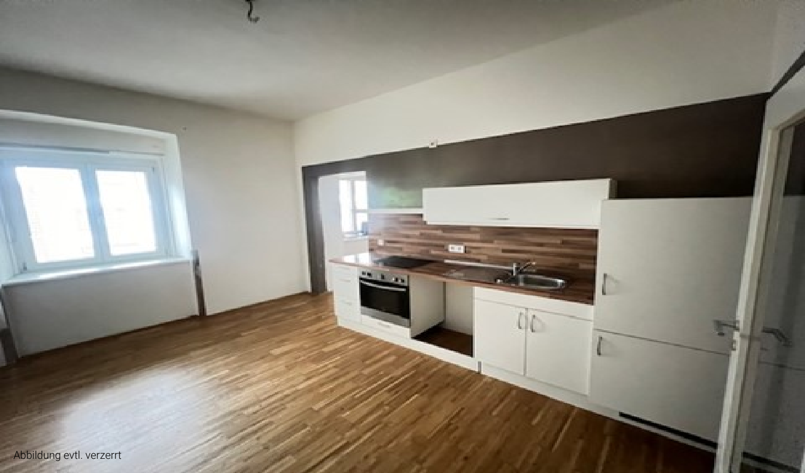
Abbildung evtl. verzerrt