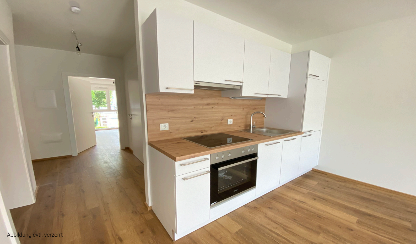
Abbildung evtl. verzerrt