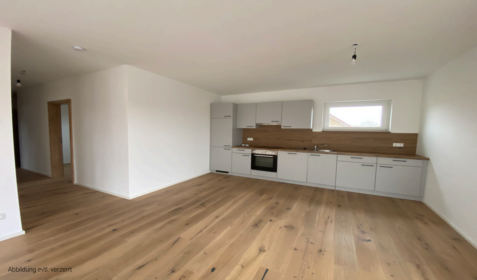
Abbildung evtl. verzerrt