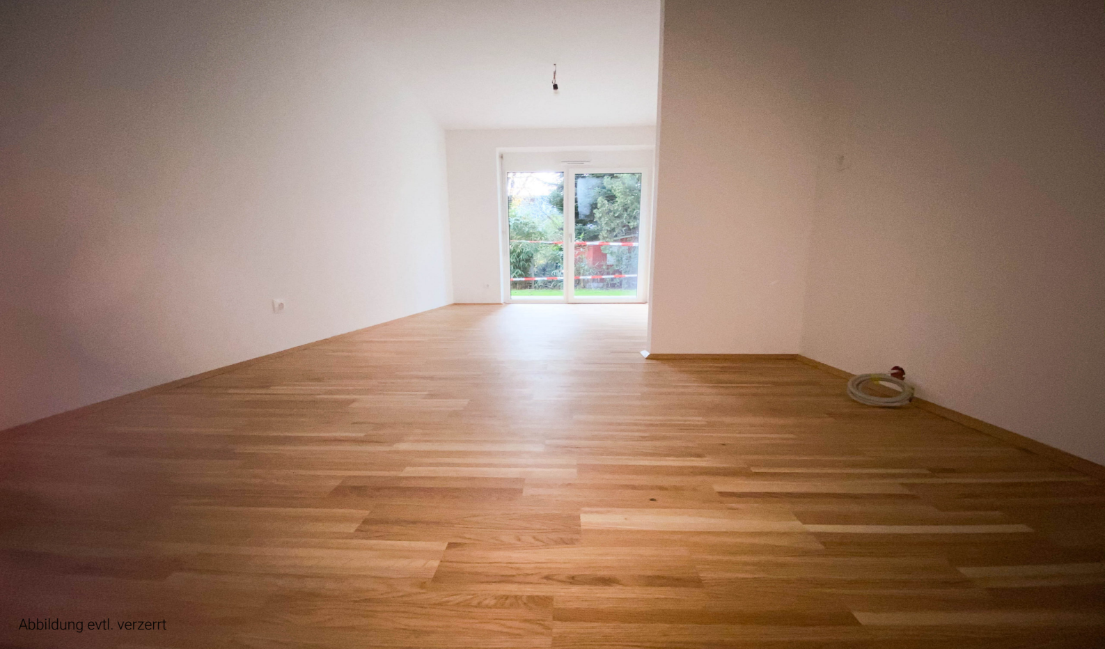
Abbildung evtl. verzerrt