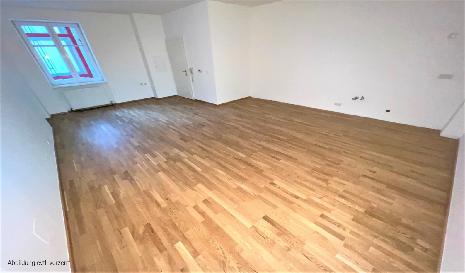
Abbildung evtl. verzerrt